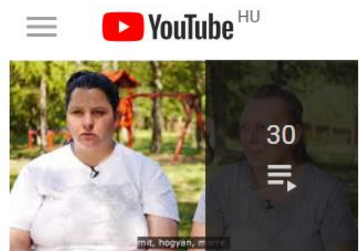
Üzenetek Lakóktól Lakóknak

https://www.youtube.com/watch?v=zhmMKNbwjEs&list=PLAHJ2f2vZW9Gj11-mrwbnkWKwC43UtXhG