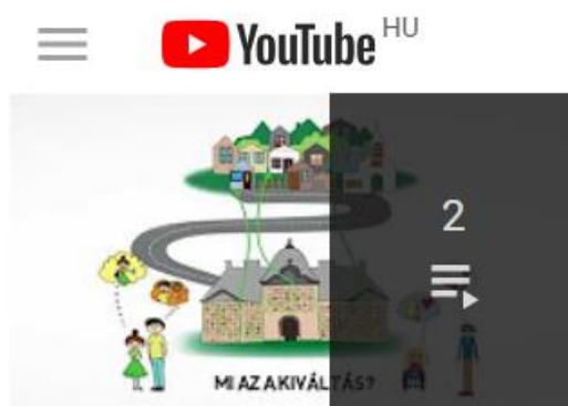
Mi az a kiváltás?